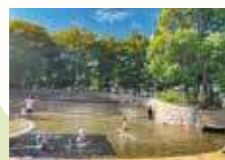
北柏ふるさと公園