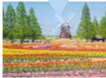
あけほの山農業公園